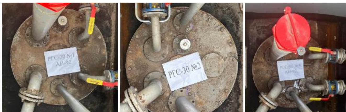
Рисунок 2 – Горловины резервуаров РГС-30 зав.№№ 1, 2, 3

Пломбирование резервуаров РГС-30 не предусмотрено.