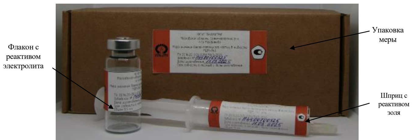
Рисунок 1 – Общий вид комплекта поставки мер значения дзета-потенциала частиц в жидкости МДП-П45

Общий вид комплекта поставки мер представлен на рисунке 1.