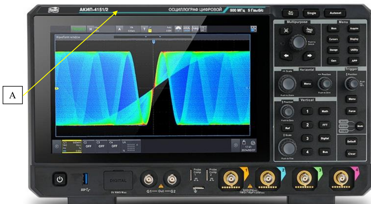
Рисунок 1 – Общий вид осциллографов и место нанесения знака утверждения типа (А)

Общий вид осциллографов и место нанесения знака утверждения типа представлены на рисунке 1. Надписи функциональных кнопок, пункты меню осциллографов и интерфейс пользователя могут быть реализованы на английском или русском языке (определяется условиями заказа на поставку). Место нанесения серийного номера, знака поверки и схема пломбировки представлены на рисунке 2.