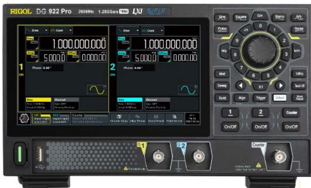
Рисунок 1 – Передняя панель генераторов RIGOL DG900Pro