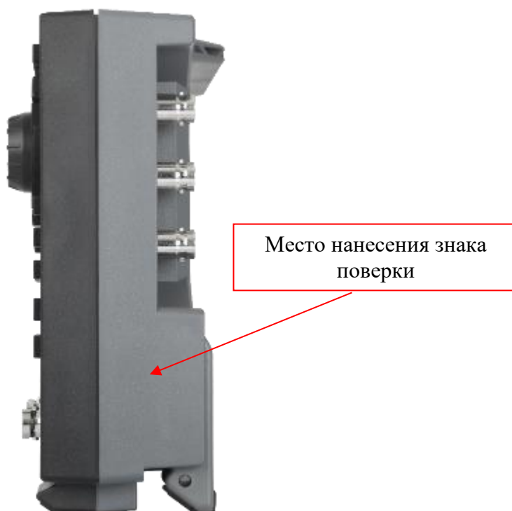
Рисунок 3 – Боковая панель генераторов RIGOL DG900Pro