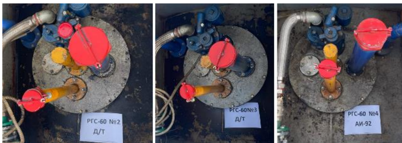
Рисунок 3 – Горловины резервуаров РГС-60 зав.№№ 2, 3, 4