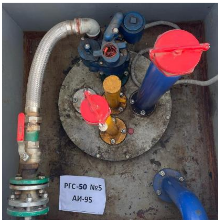
Рисунок 2 – Горловина резервуара РГС-50 зав.№ 5