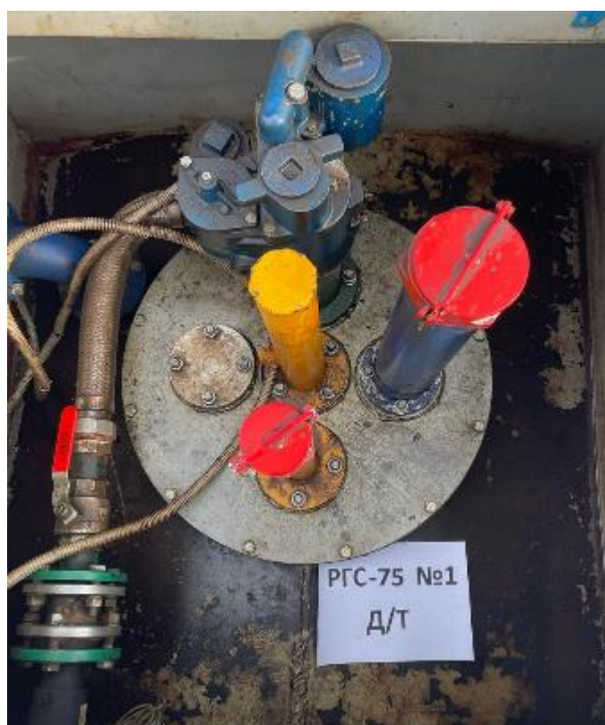
Рисунок 4 – Горловина резервуара РГС-75 зав.№ 1

Пломбирование резервуаров РГС не предусмотрено.