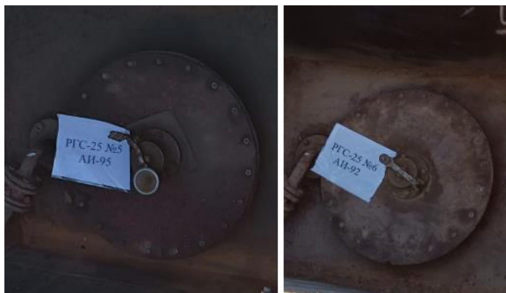
Рисунок 5 – Горловины резервуаров РГС-25 зав.№№ 5, 6

Пломбирование резервуаров РГС-25 не предусмотрено.