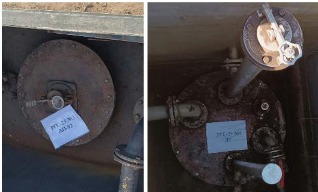
Рисунок 4 – Горловины резервуаров РГС-25 зав.№№ 3, 4