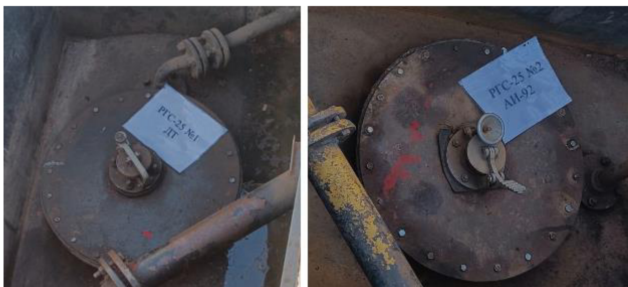
Рисунок 3 – Горловины резервуаров РГС-25 зав.№№ 1, 2