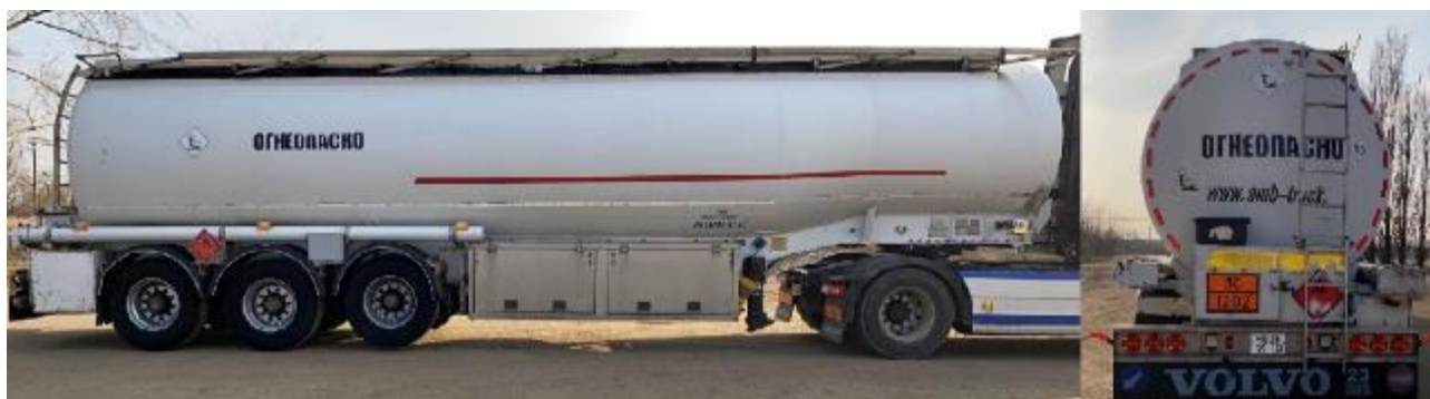
Рисунок 1 – Общий вид ППЦ FRUEHAUF

Общий вид ППЦ FRUEHAUF зав.№ VFКTF34T1W3RA1004 представлен на рисунке 1.