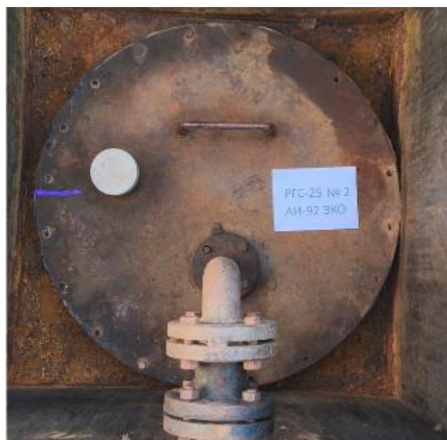
Рисунок 4 – Горловины резервуаров РГС-25 зав.№№ 1, 2