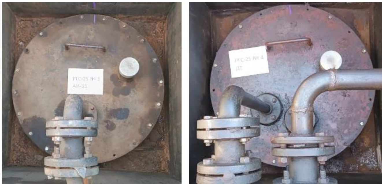
Рисунок 5 – Горловины резервуаров РГС-25 зав.№№ 3, 4

Пломбирование резервуаров РГС не предусмотрено.