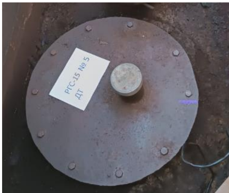
Рисунок 3 – Горловина резервуара РГС-15 зав.№ 5