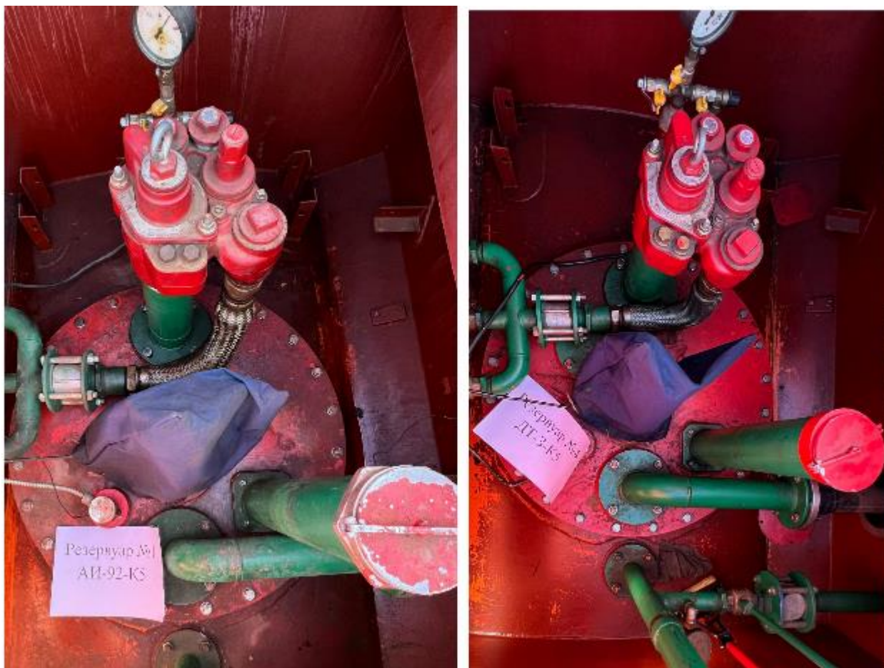
Рисунок 3 – Горловины резервуаров РГС-50 зав.№№ 1, 4

Пломбирование резервуаров РГС не предусмотрено.