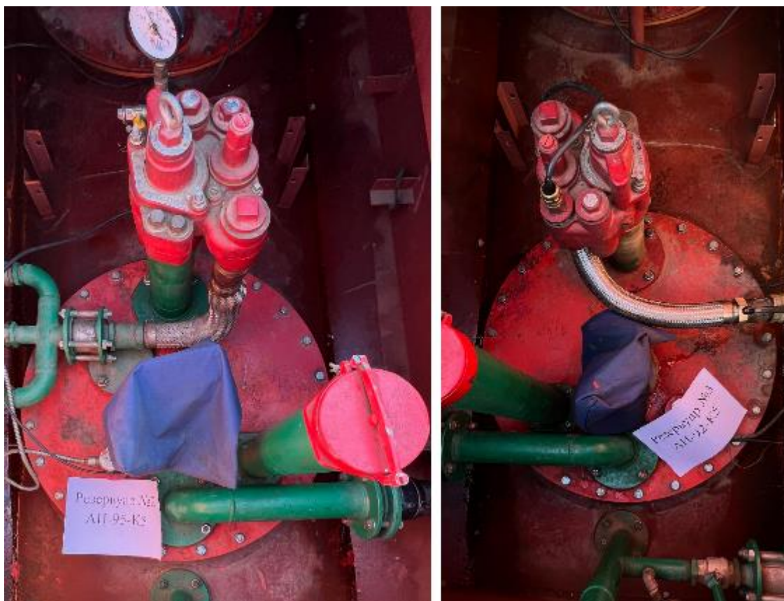
Рисунок 2 – Горловины резервуаров РГС-25 зав.№№ 2, 3