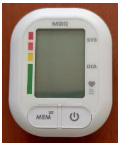
Модификация V1 Original