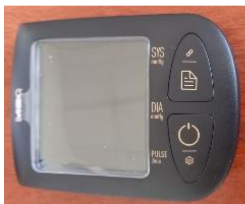
Модификация V3 Onyx