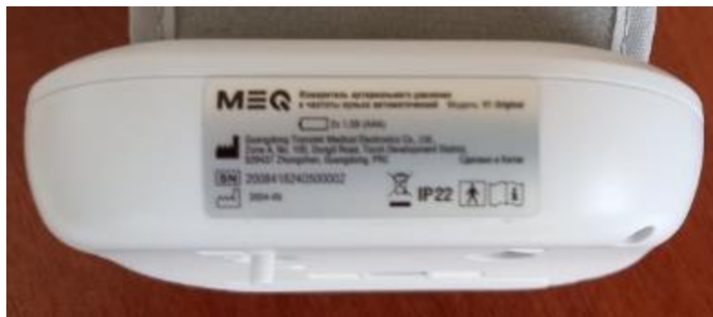
Рисунок 2 – Схема маркировки и место нанесения серийного номера измерителей артериального давления и частоты пульса автоматических MEQ модификации: V1 Original, V2 Comfort