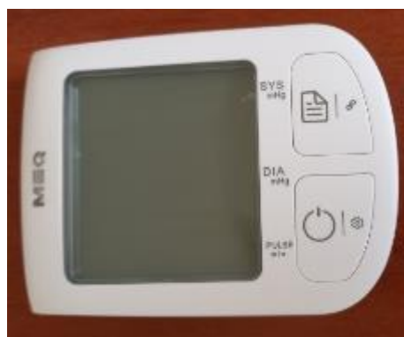
Модификация V3 Smart