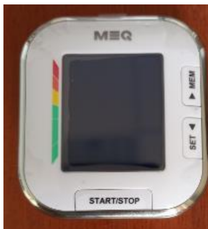
Модификация V2 Comfort