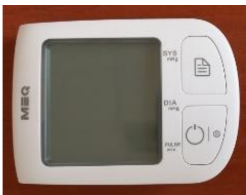
Модификация V3 Original