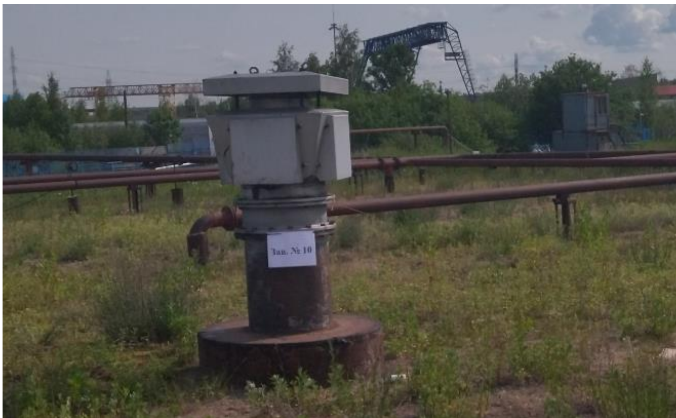
Рисунок 3 – Горловина резервуара ЖБР-10000 № 10

Пломбирование резервуаров ЖБР-10000 не предусмотрено.