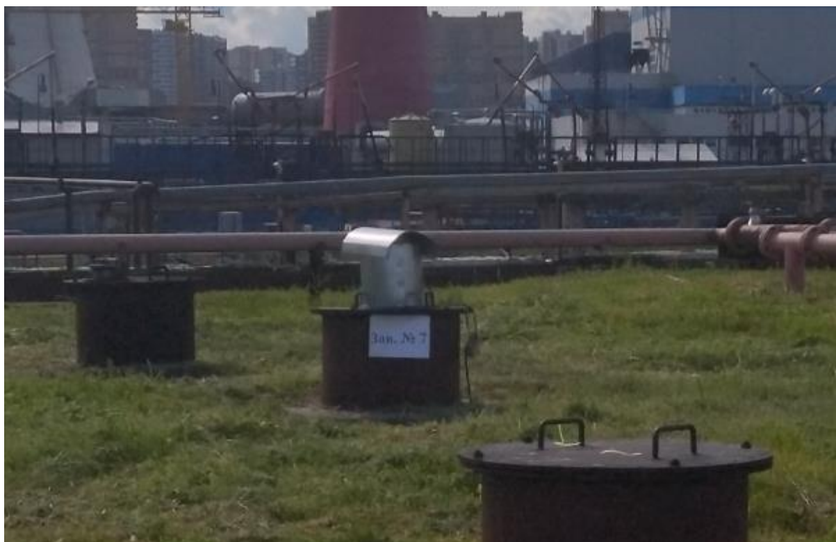
Рисунок 2 – Горловина резервуара ЖБР-10000 № 7