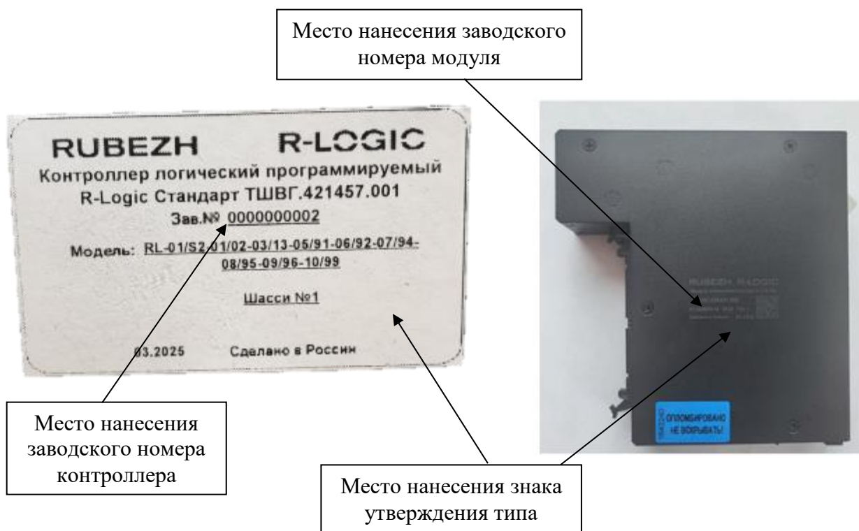
Рисунок 4 – Места нанесения место нанесения заводских номеров и знака утверждения типа