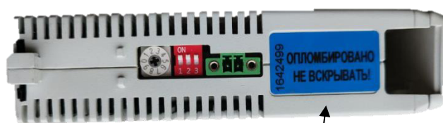
Пломбировочная наклейка завода-изготовителя