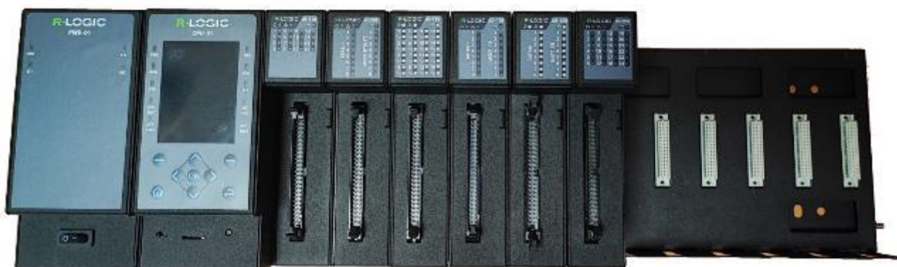
Рисунок 2 – Общий вид контроллера R-Logic Стандарт. Стандарт. Исполнение модулей в металлических корпусах