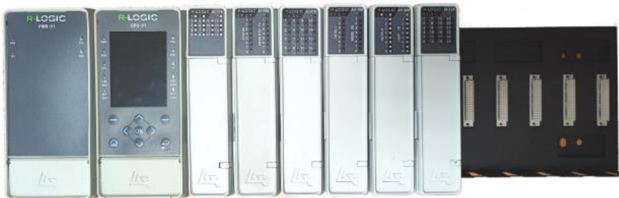
Рисунок 1 – Общий вид контроллера R-Logic Стандарт. Исполнение модулей в пластмассовых корпусах