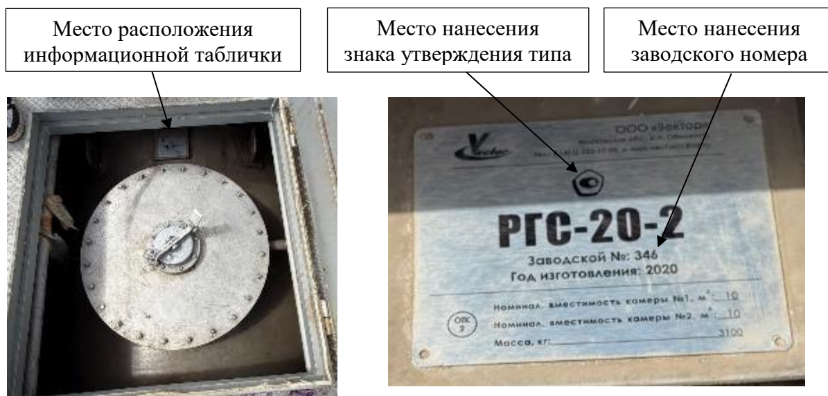
Рисунок 2 – Общий вид горловины резервуара, обозначение места нанесения заводского номера на информационную табличку