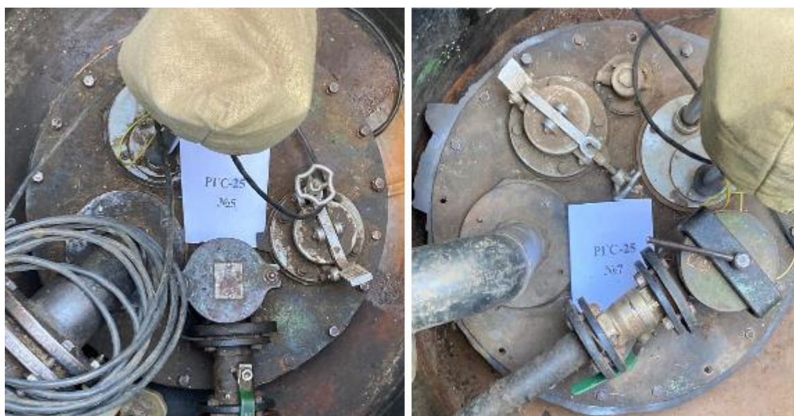
Рисунок 3 – Горловины резервуаров РГС-25 зав.№№ 5, 7

Пломбирование резервуаров РГС-25 не предусмотрено.