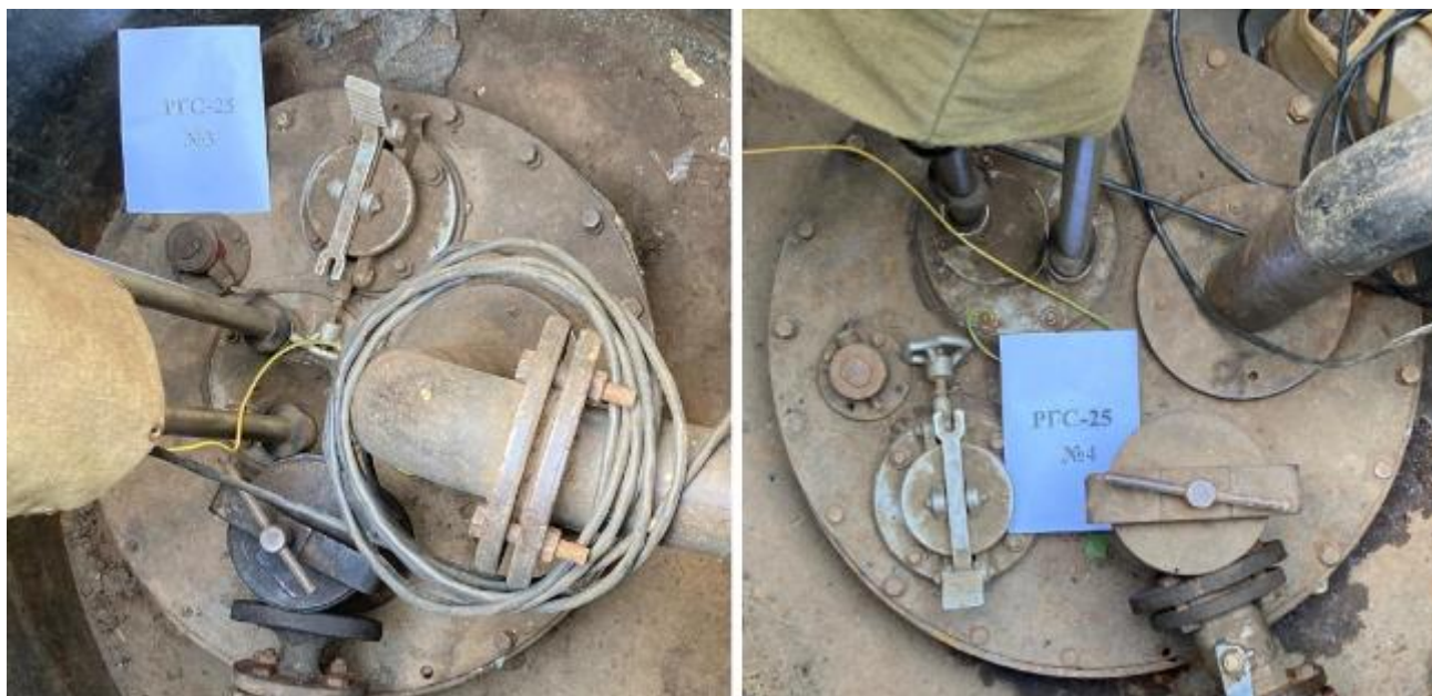
Рисунок 2 – Горловины резервуаров РГС-25 зав.№№ 3, 4