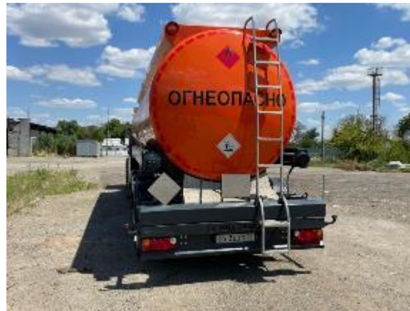
Рисунок 1 – Общий вид ППЦ ОКТ Trailer S251.35A