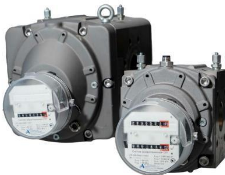
Рисунок 1 – Общий вид основных исполнений

Заводской номер в виде цифрового кода наносится на циферблат отсчетного механизма методом лазерной гравировки. Места нанесения заводского номера и знака утверждения типа представлены на рисунке 2. Схема пломбировки от несанкционированного доступа и место нанесения знака поверки представлены на рисунке 3.