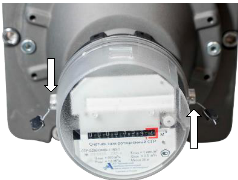
Рисунок 3 – Схема пломбировки от несанкционированного доступа и место нанесения знака поверки