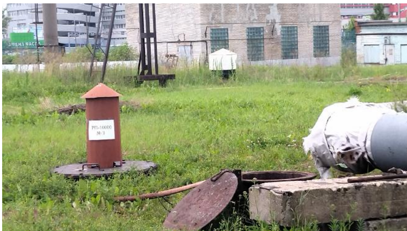
Рисунок 2 – Горловина резервуара РП-10000 № 3