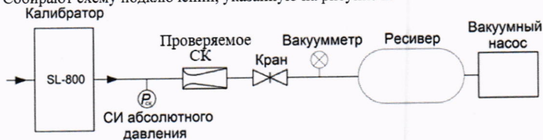
Рисунок 2 – Схема подключений СК к ЭУ-5

Собирают схему подключений, указанную на рисунке 2.