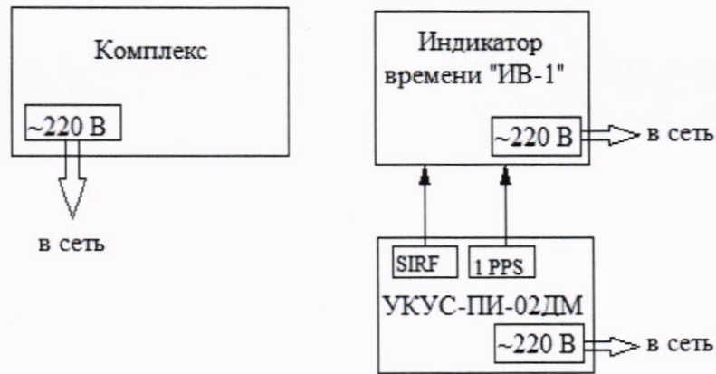
Рисунок 1 – Схема проведения измерений

10.1.2 Обеспечить радиовидимость сигналов навигационных космических аппаратов ГЛОНАСС в верхней полусфере. Поместить индикатор времени «ИВ-1» в поле зрения поворотной камеры.