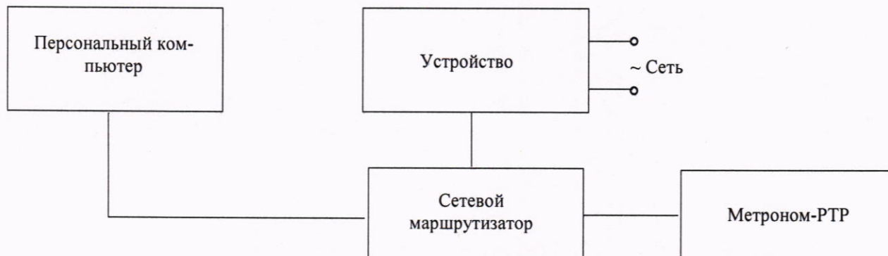
Рисунок 3 - Схема подключений при определении абсолютной погрешности хода часов за сутки

2) Изменить сетевые настройки (IP-адрес и основной шлюз) Метроном-РТР в соответствии с IP-адресом устройства, присвоив устройству и Метроном-РТР один адрес сети и подсети.