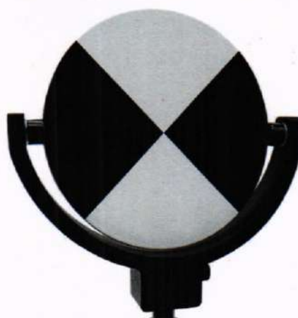
Рисунок 1 – Визирная марка

10.1.4 Создать план траектории движения сканера согласно рекомендациям руководства по эксплуатации. Пример траектории для сканирования приведён на рисунке 2.