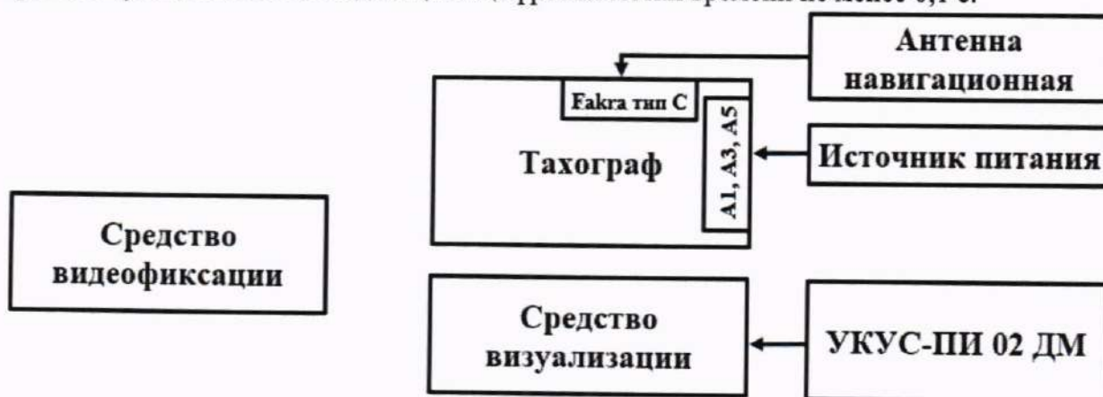
Рисунок 4 – Схема проведения измерений при определении абсолютной погрешности синхронизации шкалы времени внутреннего опорного генератора тахографа со шкалой времени блока СКЗИ

10.8.1 Собрать схему в соответствии с рисунком 4. Средство визуализации должно иметь разрешающую способность индикации оцифровки метки времени не менее 0,1 с.