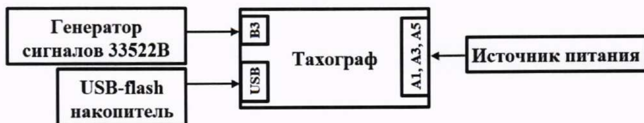
Рисунок 3 – Схема проведения измерений при определении абсолютной инструментальной погрешности измерений скорости по датчику движения

10.3.2 В соответствии с руководством по эксплуатации генератора сигналов 33522В, настроить генератор сигналов 33522В выдачу последовательности прямоугольных импульсов (параметры приведены в п. 10.1.2) частотой f , вычисляемой по формуле (6):