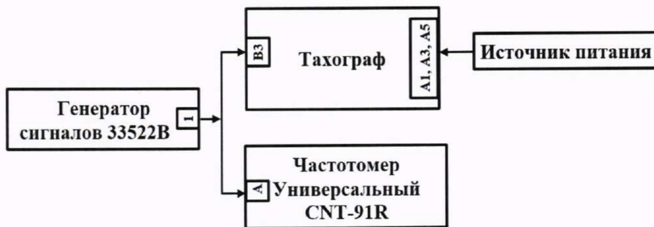
Рисунок 2 – Схема проведения измерений при определении абсолютной погрешности измерений интервала времени и абсолютной инструментальной погрешности измерений пройденного пути

10.1.1 Собрать схему в соответствии с рисунком 2.