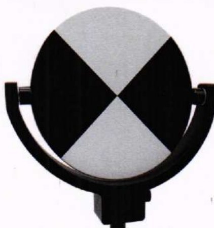
Рисунок 1 – Визирная марка

10.1.4 Создать план траектории движения сканера согласно рекомендациям руководства по эксплуатации. Пример траектории для сканирования приведён на рисунке 2.