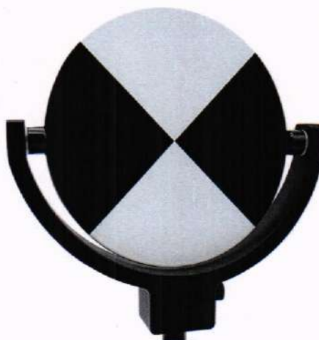
Рисунок 1 – Визирная марка

10.1.3 Установить визирные марки для сканирования (далее – марки) на пункты комплекса, используемые для измерений в соответствии с требованиями предыдущего пункта, выполнить горизонтирование марок в двух плоскостях, измерить высоту их установки от центра пункта до центра марки с помощью рулетки измерительной. Марка представляет собой квадратный или круглый щит размером не менее 150×150 мм, поверхность щита окрашивается белой краской или разделена на черно-белые секторы. Располагать марку следует к сканеру таким образом, чтобы плоскость марки была перпендикулярна направлению на сканер. Пример марки приведён на рисунке 1.