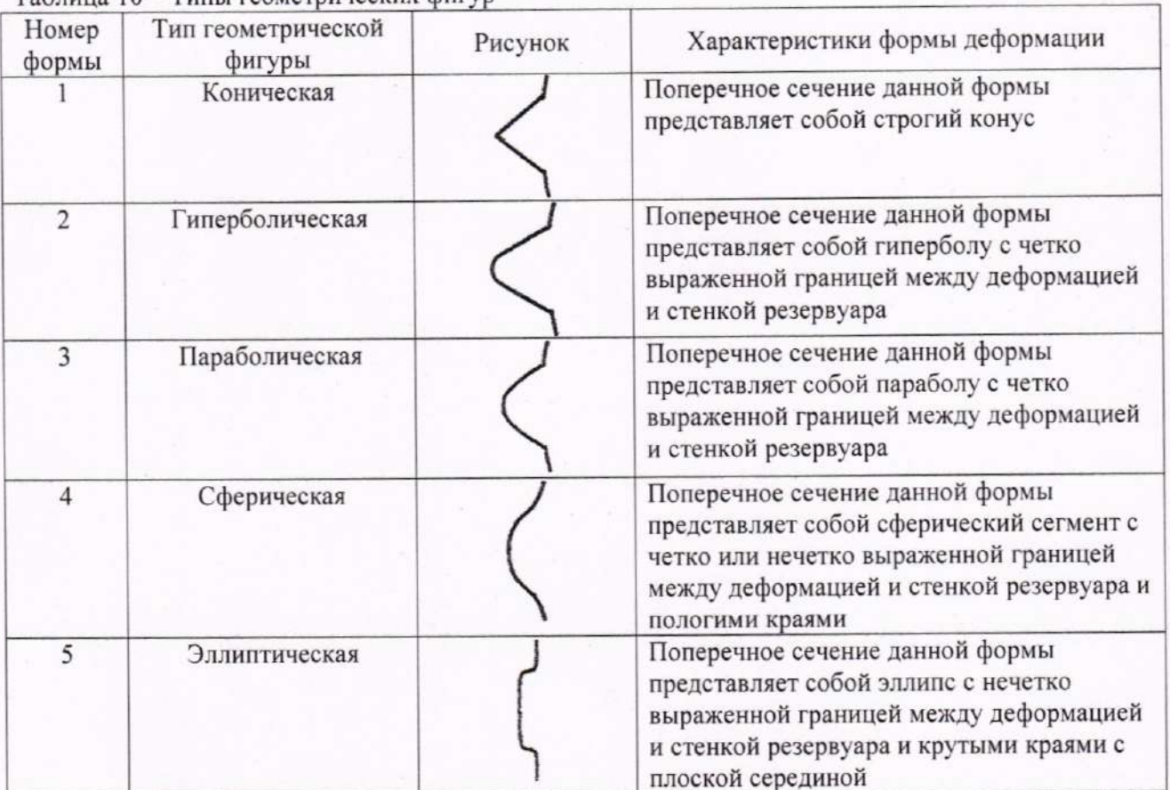
Таблица 10 – Типы геометрических фигур

Определяют тип геометрической фигуры, которому соответствует форма деформации днища и стенок резервуара (эллипс, гипербола, сферический сегмент, конус, параболический сегмент) в соответствии с таблицей 10.