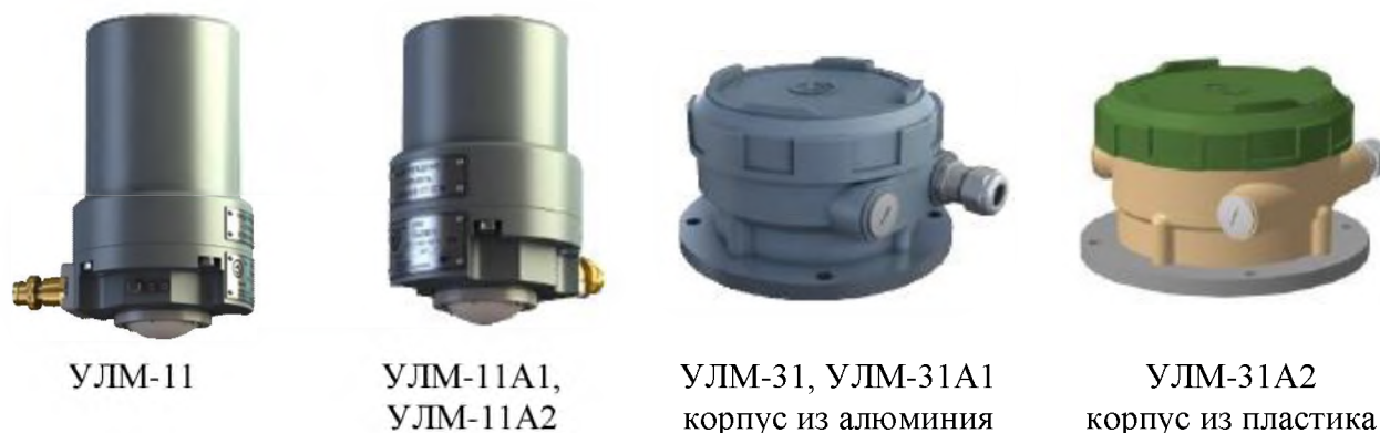
Рисунок 1 – Общий вид уровнемеров

Пломбирование уровнемеров производится при помощи этикетки с защитным слоем. Этикетка после удаления оставляет трудно удаляемый слой.