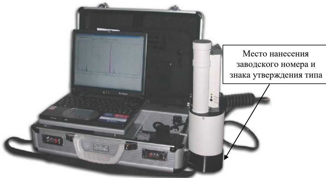
Рисунок 1 - Внешний вид анализаторов рентгенофлуоресцентных энергодисперсионных «Призма» в переносном варианте исполнения

Нанесение знака поверки на анализаторы не предусмотрено.