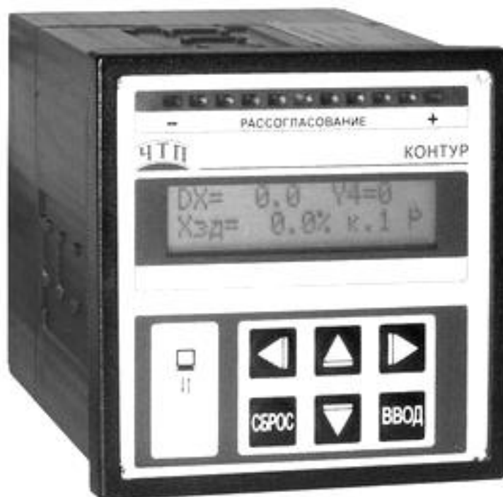
Рисунок 1 – Общий вид регулятора

Общий вид регулятора представлен на рисунке 1.