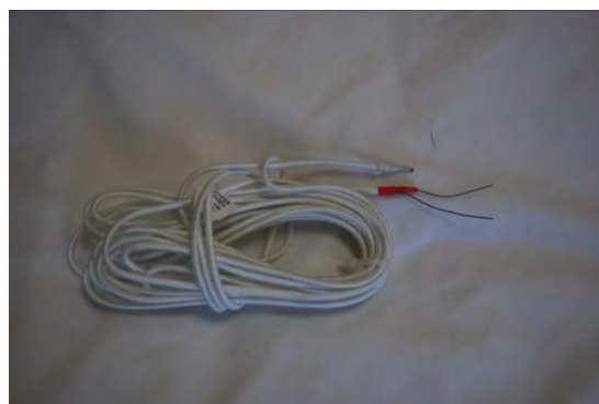
Рисунок 1 – Общий вид бескорпусных ДТП модификации XX1