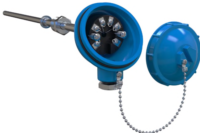
Рисунок 4 – Общий вид ДТП модификации XX5 со встроенным нормирующим преобразователем