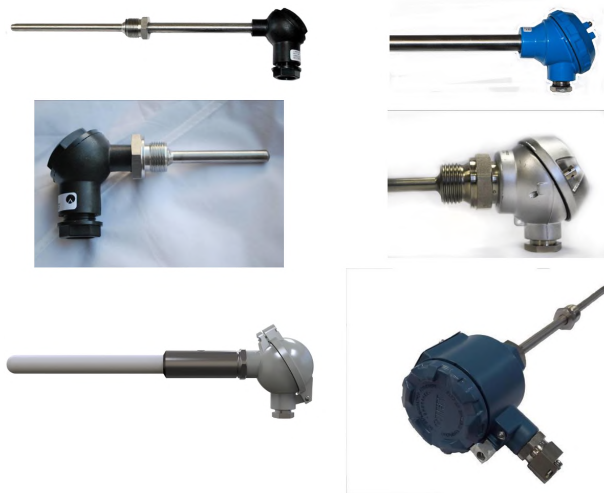
Рисунок 3 – Общий вид ДТП с клеммными головками модификации XX5