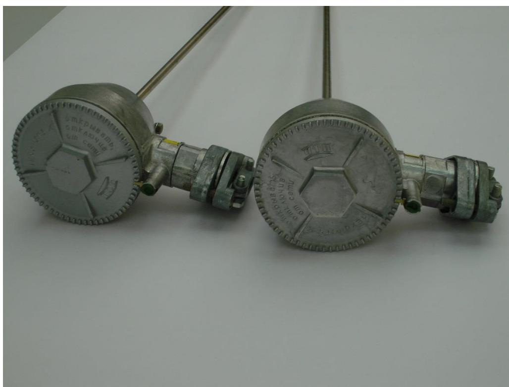
Рисунок 2 – Термопреобразователи сопротивления взрывозащищённые Общий вид.