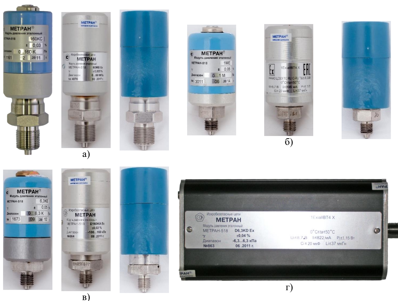
Рисунок 1 – Внешний вид модулей давления эталонных Метран-518:

Схемы пломбировки от несанкционированного доступа представлены на рисунке 2.