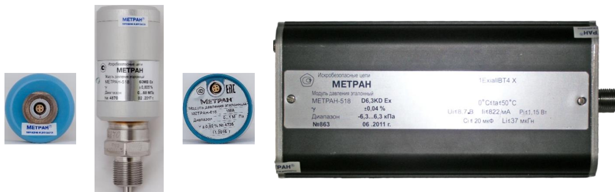
Рисунок 2 – Схемы пломбировки от несанкционированного доступа

Нанесение знака поверки на модули не предусмотрено.