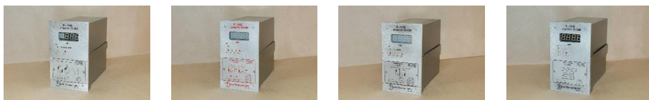
Рисунок 2 – Блоки контроля