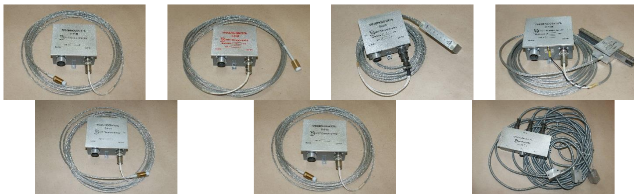
Рисунок 4 – Преобразователи с датчиками.

Датчики устанавливаются непосредственно на объекте контроля, нормирующие преобразователи – в непосредственной близости от объекта контроля на фундаменте или раме турбоагрегата и соединяются посредством кабельных связей с блоками контроля.