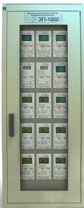
Рисунок 1 – Аппаратура контроля механических параметров турбоагрегатов ЭП-1000

Аппаратура выпускается в виде отдельных блоков, содержащих один, два, три или четыре измерительных канала (рисунок 2), либо в виде измерительного комплекса – блоки контроля устанавливаются в шкафы «Евромеханика» (рисунок 1).