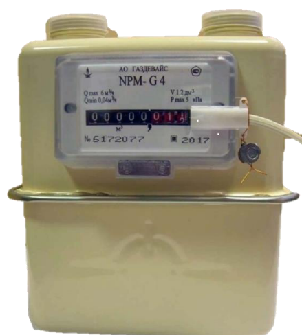
Рисунок 2 – Общий вид счетчиков с датчиком импульсов счетчиков в исполнении ГАЗДЕВАЙС