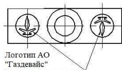
Рисунок 7 – Пломбирование от несанкционированного доступа, обозначение мест нанесения логотипа АО «Газдевайс».