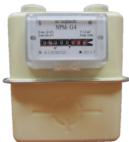
Рисунок 1 – Общий вид счетчиков в исполнении ГАЗДЕВАЙС

Пломбировку счетчиков в исполнении СЕВЕРУС от несанкционированного доступа осуществляют нанесением знака поверки давлением клейма на пломбу. Схема пломбировки от несанкционированного доступа, обозначение места нанесения знака поверки и заводского клейма, заводского номера и знака утверждения типа представлены на рисунке 9.