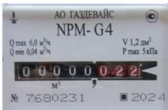
Рисунок 4 – Маркировка нанесена на табличку