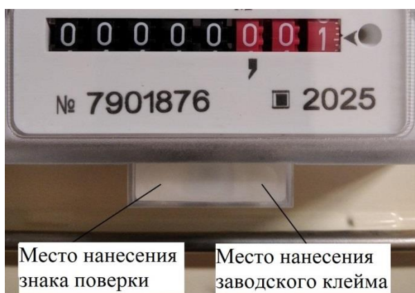
Рисунок 6 – Схема пломбирования от несанкционированного доступа, обозначение мест нанесения знака поверки и заводского клейма.