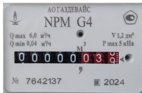
Рисунок 5 – Маркировка нанесена на корпус сумматора