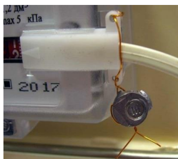
Рисунок 8 – Место пломбирования датчика импульсов