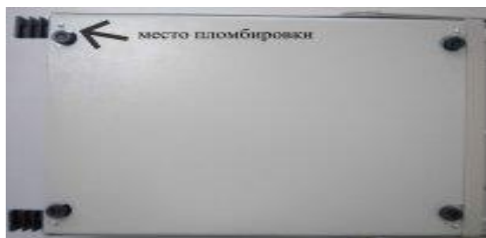
Рисунок 2 – Нижняя панель осциллографов