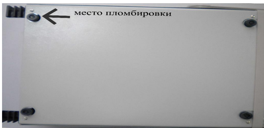
Рисунок 2 – Нижняя панель осциллографов