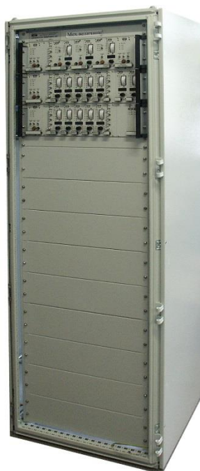
Рисунок 1 – Аппаратура «Вибробит 100»

Внешний вид аппаратуры «Вибробит 100» представлен на рисунке 1, структурная схема представлена на рисунке 2.