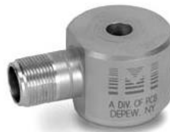
Датчик модели 625B01