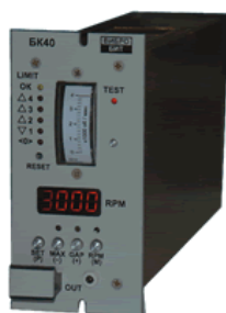
Рисунок 9 – Блоки контроля серии БК

Внешний вид блоков индикации приведен на рисунке 10.