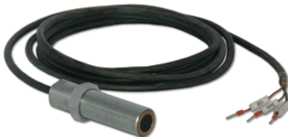
Рисунок 4 – Датчики ДХМ

Принцип действия датчиков ДХМ основан на эффекте Холла, на явлении возникновения разности потенциалов при помещении проводника с постоянным током в магнитное поле. Внешний вид датчиков ДХМ приведен на рисунке 4.