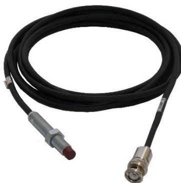
Рисунок 3 – Вихрековые датчики

Внешний вид вихрековых датчиков приведен на рисунке 3.