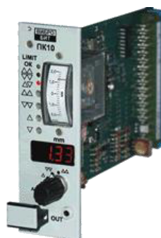
Рисунок 8 – Плата контроля серии ПК

Внешний вид платы контроля серии ПК приведен на рисунке 8.