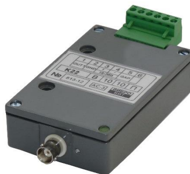
Рисунок 7 – Компараторы моделей К21 и К22

Внешний вид компараторов моделей К21 и К22 приведен на рисунке 7.