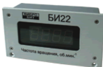
Рисунок 10 – Блоки индикации БИ22 и БИ23

Внешний вид блоков индикации приведен на рисунке 10.