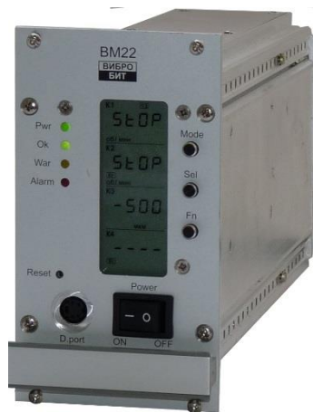
Рисунок 8 – Блоки контроля моделей ВМ22, ВМ61 и ВМ32

Внешний вид блоков контроля моделей ВМ22, ВМ61 и ВМ32 приведен на рисунке 8.