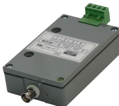
Рисунок 5 – Измерительные преобразователи ИП34 и ИП 44

Внешний вид измерительных преобразователей ИП34 и ИП 44 и приведен на рисунке 5.