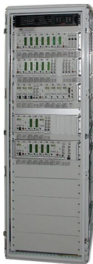
Рисунок 1 – Аппаратура «Вибробит 300»

Внешний вид аппаратуры «Вибробит 300» представлен на рисунке 1, структурная схема представлена на рисунке 2.