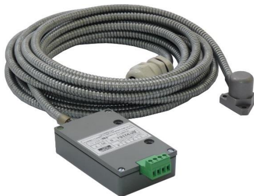
Рисунок 3 – Пьезоэлектрические датчики

Внешний вид пьезоэлектрических датчиков приведен на рисунке 3.