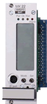
Рисунок 7 – Измерительный модуль контроля моделей МК11, МК22 и МК32

Внешний вид измерительных модулей контроля моделей МК11, МК22 и МК32 приведен на рисунке 7.