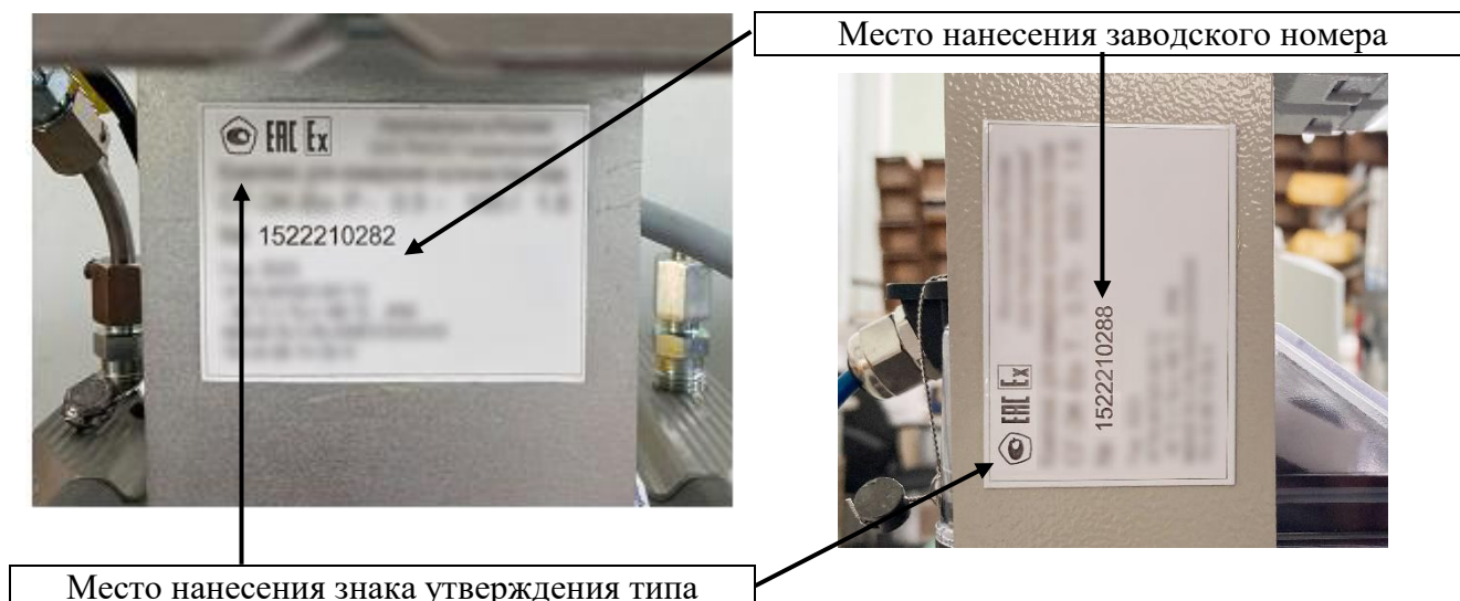
Рисунок 4 – Место нанесения заводского номера и знака утверждения типа