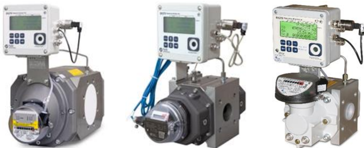
Рисунок 1 – Общий вид комплексов модификации СГ-ЭК-Р