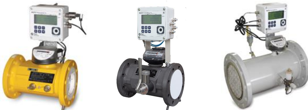
Рисунок 2 – Общий вид комплексов модификации СГ-ЭК-Т