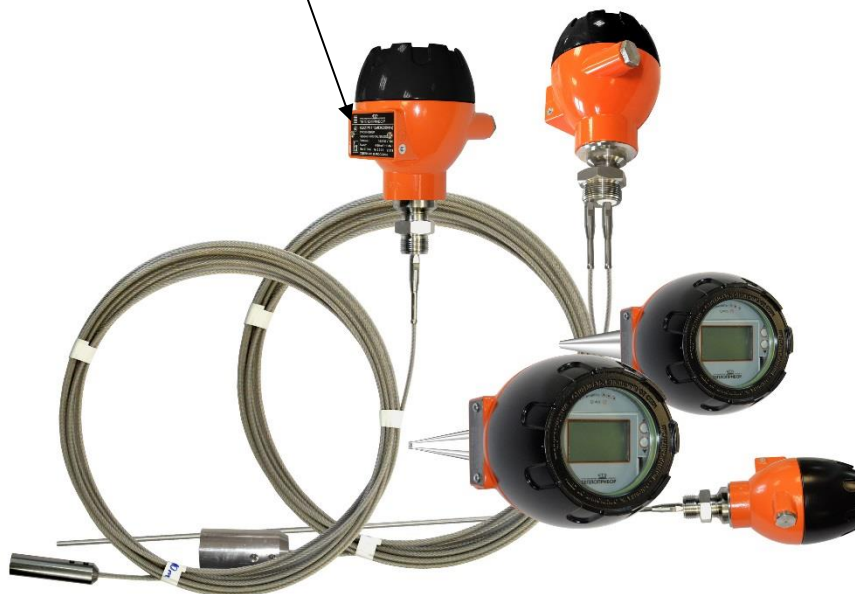
Рисунок 1 – Общий вид уровнемеров микроволновых Левелтач М