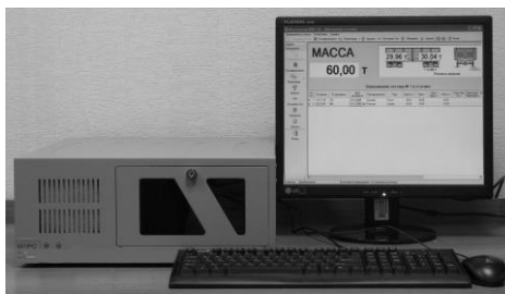
Рисунок 2 – Общий вид (пример) индикаторов М1РС-01 и терминалов М1РС-03 (слева)