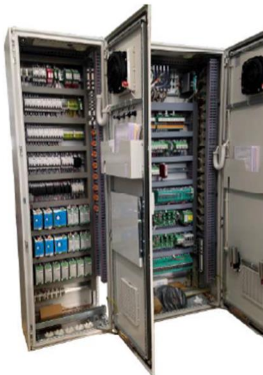
Рисунок 1 – Общий вид комплексов программно-технических НЕМАН-Р

Пломбирование комплексов не предусмотрено.