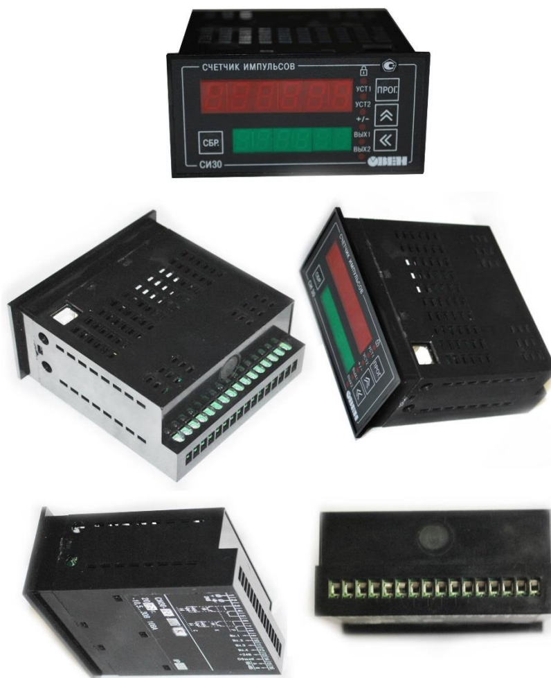
Рисунок 3 – Общий вид СИЗ0 в корпусе Щ2