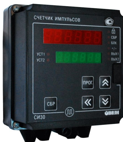
Рисунок 1 – Общий вид СИ30 в корпусе Н

Номинальное напряжение питания: 220 - переменного тока от 110 В; 220 В; 240 В с частотой 50 или 60 Гц; 24 - постоянного тока 24 В. Конструктивное исполнение: Н - корпус настенного крепления; Щ1 - корпус щитового крепления; Щ2 - корпус щитового крепления; Д - корпус для крепления на DIN-рейку. Тип встроенных выходных устройств: Р - Контакты электромагнитного реле; К - Оптопара транзисторная п-р-п-типа; С - Оптопара симисторная.