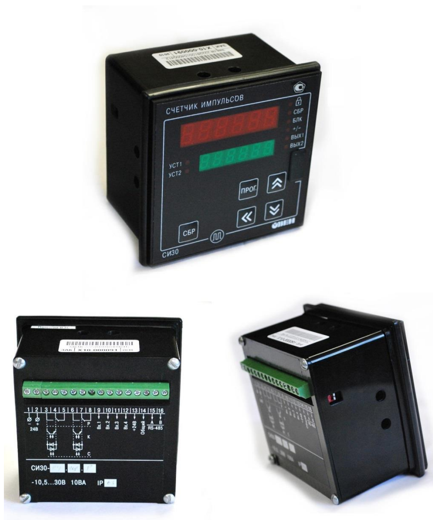
Рисунок 2 – Общий вид СИЗ0 в корпусе Щ1