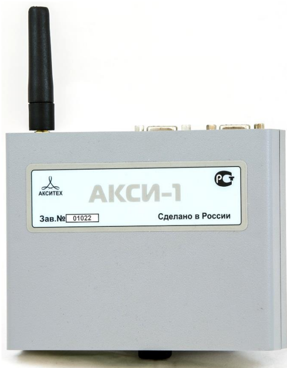
Рисунок 2 – Внешний вид контроллеров АКСИ

Пломбирование контроллеров не предусмотрено.