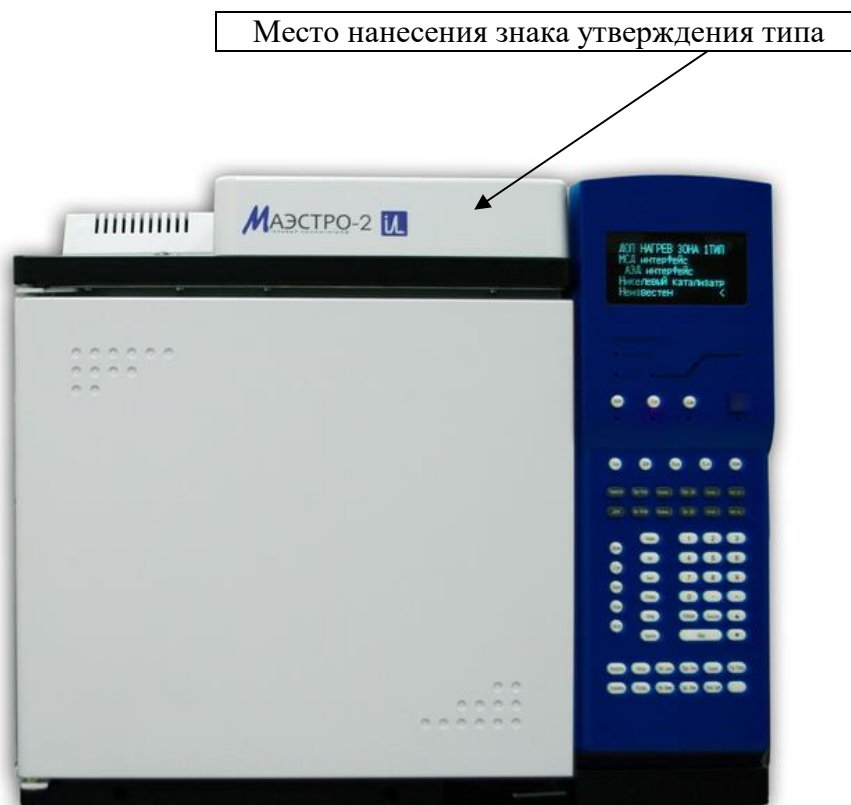
Рисунок 1 – Общий вид хроматографов (вид спереди)