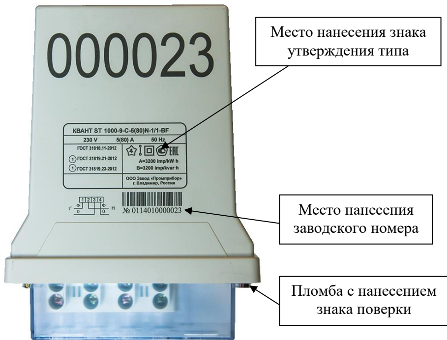
Рисунок 3 – Общий вид счетчика в исполнении корпуса типа С с указанием места ограничения доступа к местам настройки (регулировки), места нанесения знака утверждения типа, места нанесения заводского номера