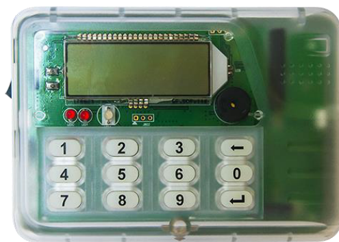
Рисунок 4 – Общий вид индикаторного устройства