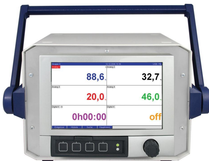
Рисунок 2 – Общий вид прибора Мемограф-М1 в настольном исполнении