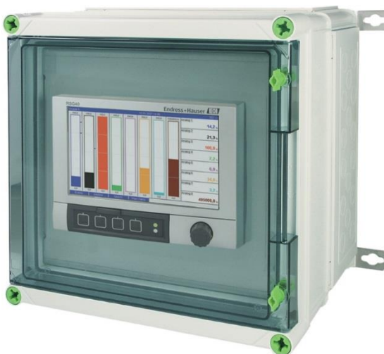
Рисунок 3 – Общий вид прибора Мемограф-М1 в полевом исполнении

Пломбирование приборов не предусмотрено.