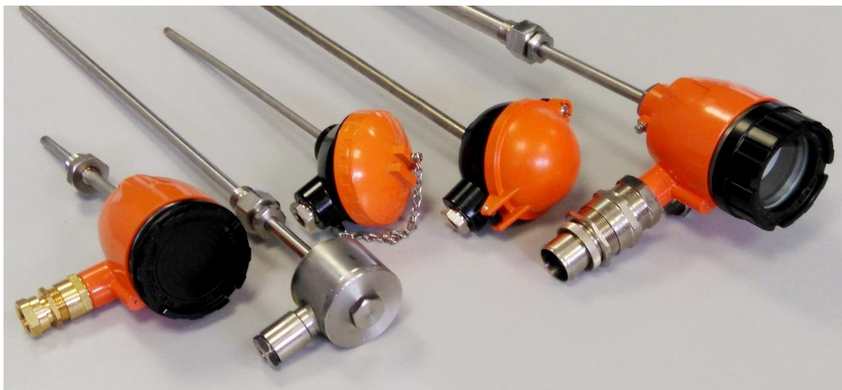
Рисунок 1 – Датчики температуры серий ТП, ТР

Фотографии общего вида датчиков приведены на рисунке 1.