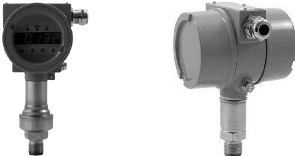
Рисунок 4 – Общий вид датчиков давления CROCUS B штуцерного исполнения