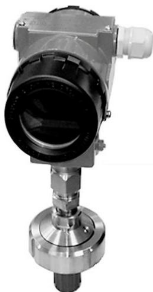
Рисунок 2 – Общий вид датчика давления CROCUS L с разделителем сред