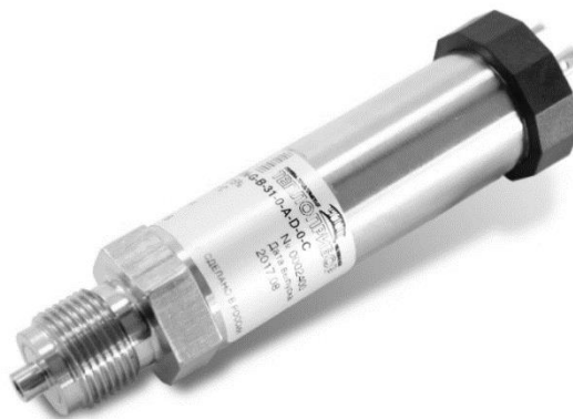
Рисунок 5 – Общий вид датчика давления CROCUS F

Пломбирование датчиков не предусмотрено.