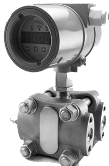
Рисунок 3 – Общий вид датчика давления CROCUS B фланцевого исполнения