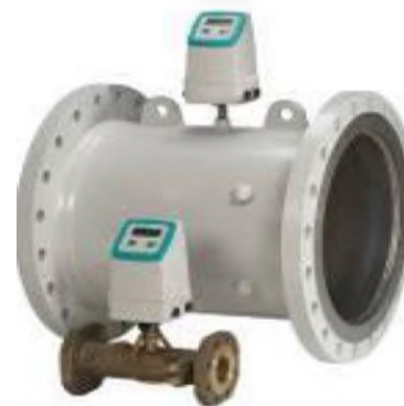
Sitrans F US