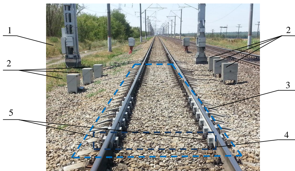
Рисунок 1 – Общий вид напольного оборудования СЖДК.ВМ

1 – шкаф телекоммуникационный, 2 – ящик путевой, 3 – ГПУ, 4 – весоизмерительное устройство, 5 – датчик тензометрический рельсовый с защитными кожухами