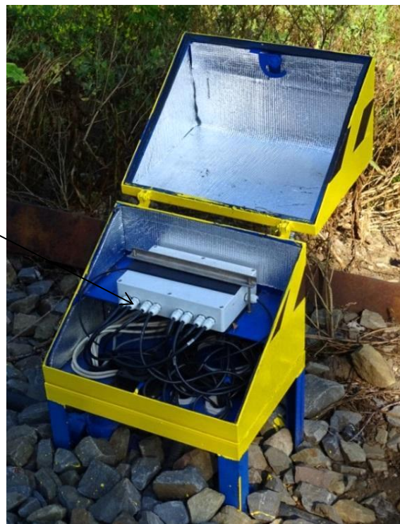
Рисунок 4 – Схема пломбировки УОАД

Знак поверки в виде наклейки наносится в виде оттиска на свидетельство о поверке и в раздел «Сведения о проведении метрологических проверок» руководства по эксплуатации.